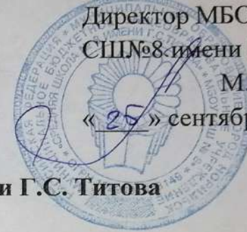
График работы родительского патруля МБОУ СШ№8 имени Г.С. Титова на октябрь 2020 г.